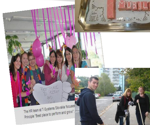
The HR team at T-Systems Slovakia focuses Principle "Best place to perform and grow"