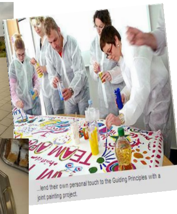
...lend their own personal touch to the Guiding Principles with a joint painting project.