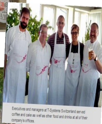
Executives and managers at T-Systems Switzerland served coffee and cake as well as other food and drinks at all of their company's offices.